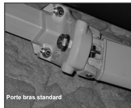
Porte bras standard