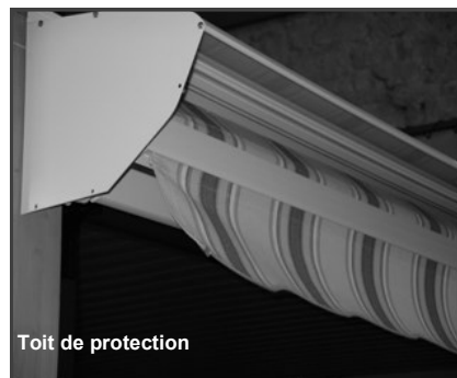
Toit de protection