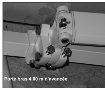
Porte bras 4,00 m d'avancée