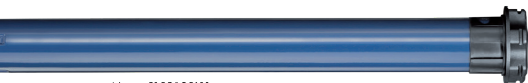
Moteur S&SO® RS100

Plus de valeur ajoutée pour les volets roulants